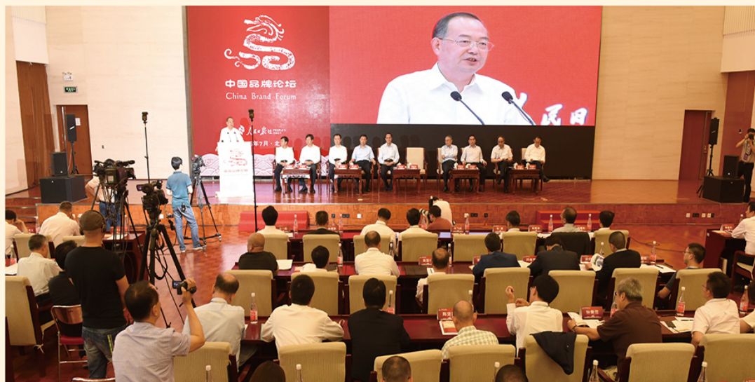
2015년 인민일보 주최 중국 브랜드 포럼 현장