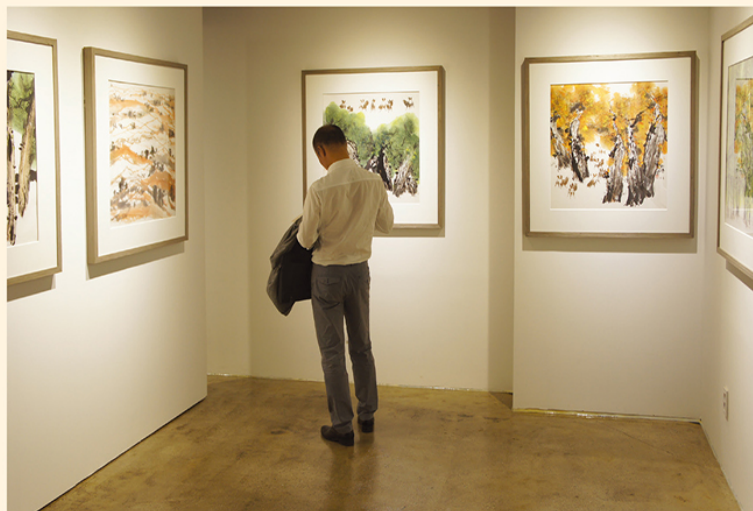
인민일보문화전매 <천가만화> 전시회, 2016년 한국대표처 갤러리에서