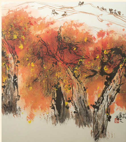
인민일보문화전매 <천가만화> 전시작품