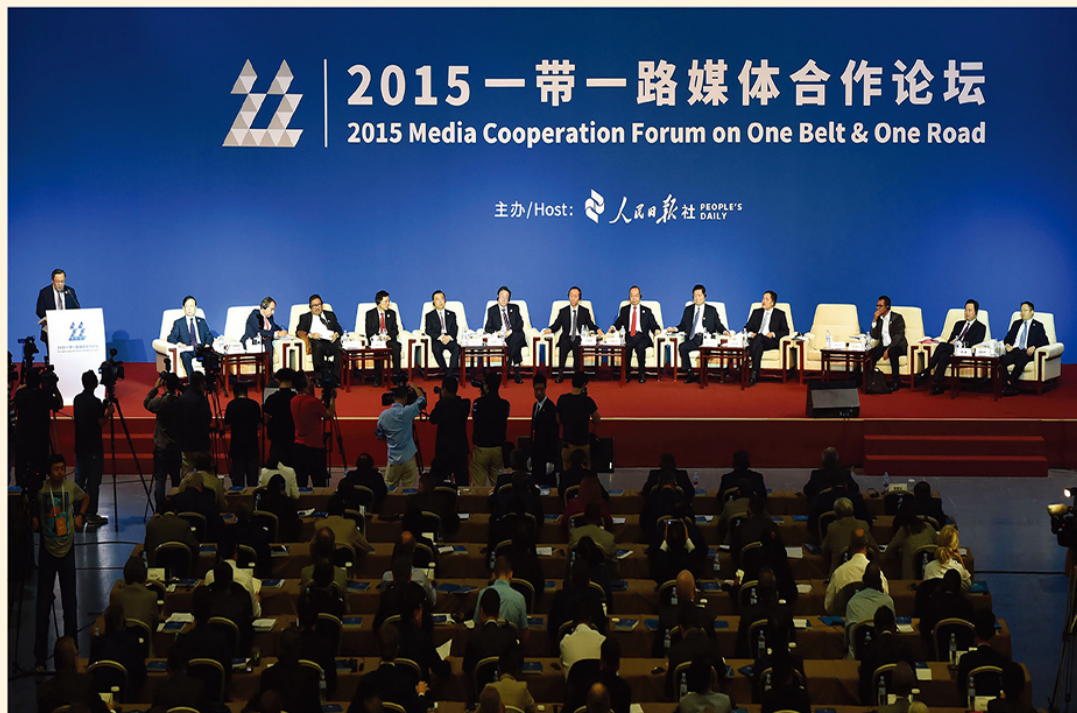
2015년 인민일보 주최 일대일로 포럼 현장