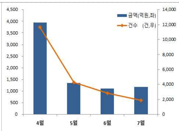
< 2금융권 대출 만기연장 >