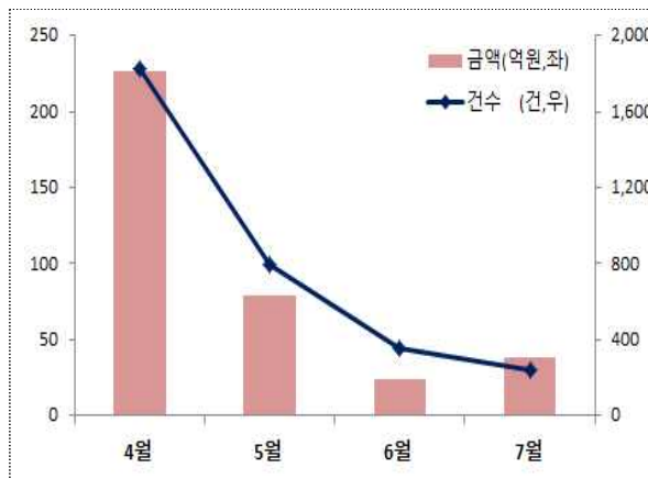
< 시중은행 이자상환 유예 >