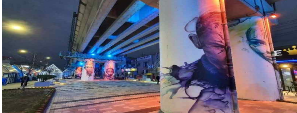
하이랜드 팸투어 트래블마트